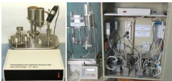
Рис. 2. Автоматизированные устройства пробоподготовки Fig. 2. Automated equipment for sample preparation

дами исходного сырья для изготовления СО утвержденных типов.